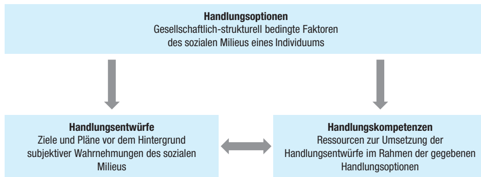
Abb. 1 Analysekonzepte der qualitativen Panelstudie